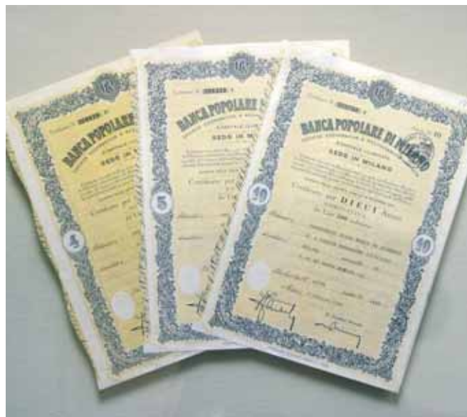
Certificati azionari emessi negli anni '60

Il Rendiconto Economico è la sezione del Bilancio Sociale che espone l'andamento gestionale del Gruppo Bipiemme e rappresenta il principale tramite di relazione con il Bilancio Consolidato. Attraverso il calcolo e la riclassificazione del Valore Aggiunto rende evidente l'effetto economico che l'attività del Gruppo ha prodotto su alcune importanti categorie di stakeholder.